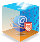
Virtual Edition web&mail

FAST360 Virtual Edition web&mail   un'architettura ibrida che sfrutta appliance hardware NPA efficienti (per filtrare i flussi al livello OSI da 4 a 7 mantenendo la connettivit  d'infrastruttura (VPN IPsec) e appliance virtuali (che beneficiano di risorse importanti ed evolutive per filtrare i dati applicativi: filtro antivirus, antispam, URL filtering, ecc.).